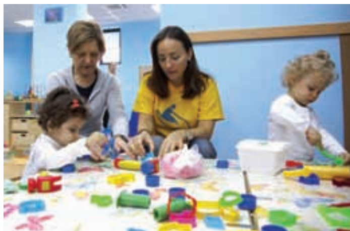
Camila Raznovich gioca con i bambini dello spazio gioco "L'Aquilone", a Milano.