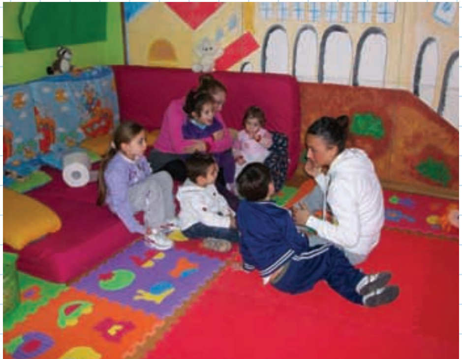
Il caldo interno del centro “Talità Kum” a Catania.

Torniamo in pieno centro palermitano, dove ci attende la visita dell’ultimo progetto sostenuto. Anche qui vengono accolti durante la settimana, tutti