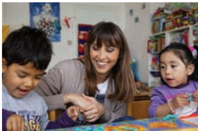
Benedetta Parodi insieme ai bimbi del centro di accoglienza "Sogno di bimbi" a Milano.