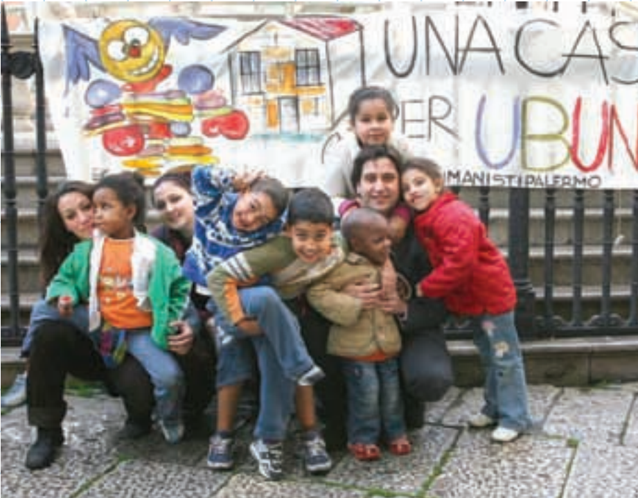
A Palermo: l'asilo del centro "Ubuntu", che significa "umanità agli altri".