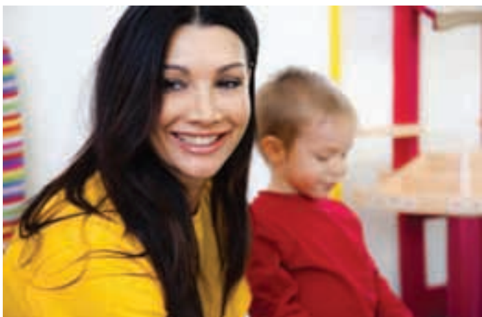
Luisa Corna in visita all'asilo nido "Pier Giorgio Frassati" a Paderno Franciacorta (Brescia).